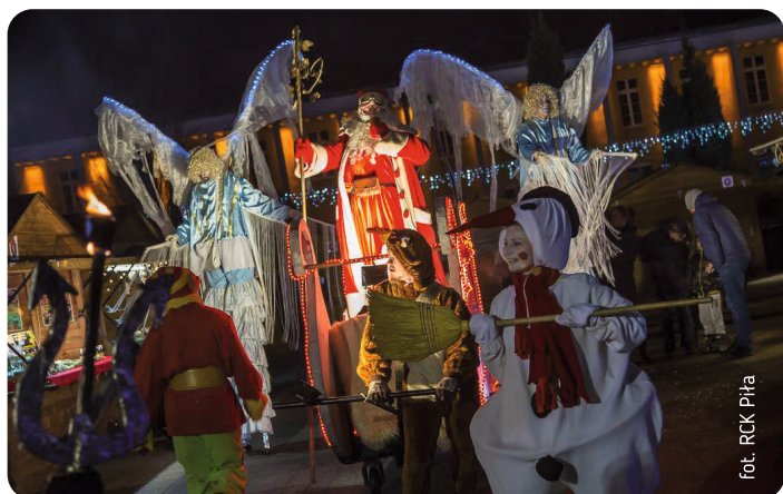
fol. RCK Piła