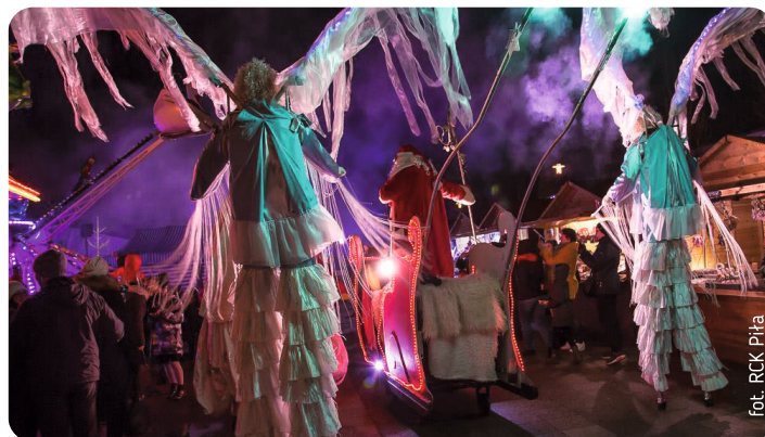
fol. RCK Piła